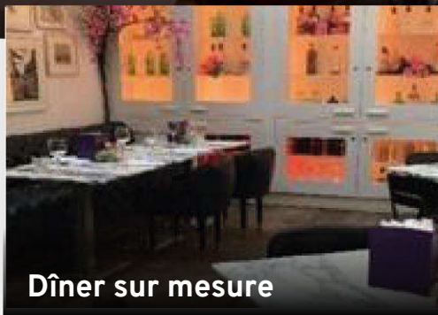
Dîner sur mesure