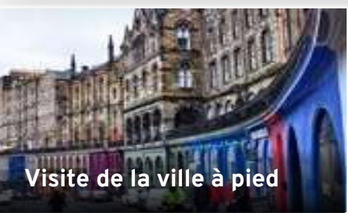
Visite de la ville à pied

Après cette visite, la fabrication du whisky n'aura plus aucun secret pour vous. Tous les mystères de cette boisson légendaire aux arômes multiples et une dégustation vous seront présentés. Durée : environ 1h