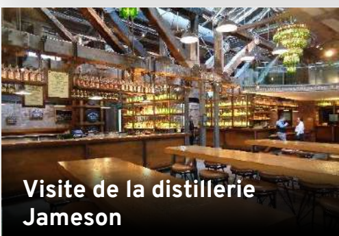
Visite de la distillerie Jameson