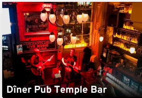
Dîner Pub Temple Bar