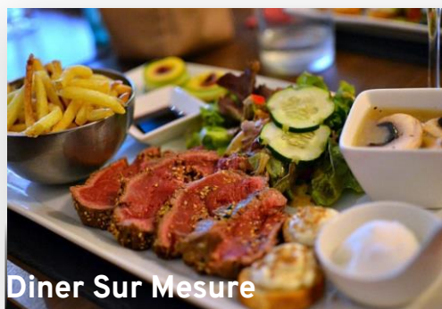
Diner Sur Mesure

En plein cœur de Cardiff, ce restaurant brésilien s'est fait un nom dans la capitale galloise grâce à son menu unique : dégustation de plus de 10 variétés de viandes servies avec un buffet d'accompagnements copieux et varié. Ce concept original saura satisfaire les gros appétits.