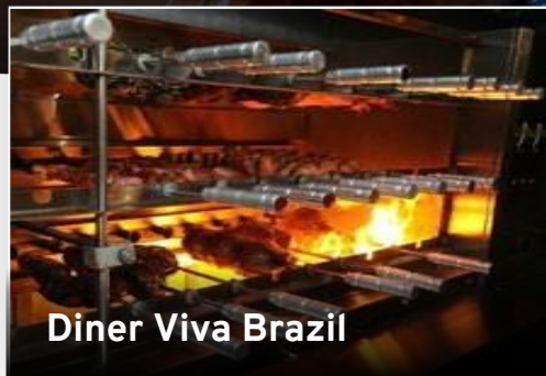
Diner Viva Brazil