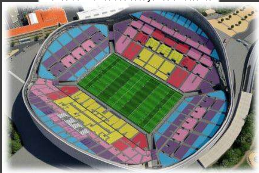
Plan du stade à titre informatif Zones définitives des catégories en attente

ATTENTION DISPONIBILITE TRES LIMITEE EN CHAMBRE TWIN (2 lits séparés)