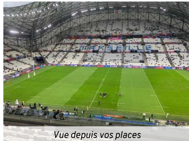
Vue depuis vos places

Les entreprises peuvent récupérer la TVA.